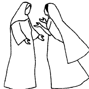
Le fruit de tes entrailles est béni ! Luc 1, 42

4- Il relève Israël et nos Pères, car il tient ses promesses ! Il bénit Abra'm et sa race, à jamais dans la tendresse.