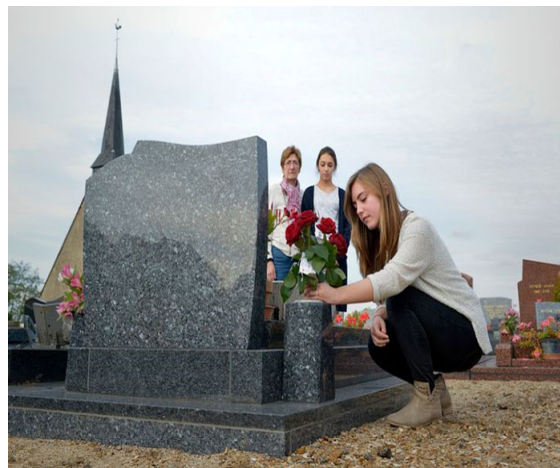
Une grand-mère et ses petites-filles viennent se recueillir au cimetière.

Florence, 45 ans, catholique, aime voir ainsi le cimetière se réveiller. « En temps ordinaire, les gens pensent à leurs morts mais cela reste invisible. Autour de la Toussaint, ce lien devient tangible, palpable, souligne-t-elle. Quand je vois une tombe fleurie, je me sens reliée à d'autres, avec lesquels je partage le fait d'aimer un proche par-delà son absence. Le cimetière est un lieu qui marque publiquement la place des morts que nous aimons toujours. »