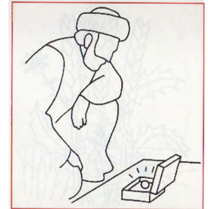
"AYANT TROUVÉ UNE PERLE DE GRANDE VALEUR" Matthieu 13, 46

Seigneur Jésus, tu es venu chercher ce qui était perdu. Nous te prions, viens nous sauver ; Ecoute-nous et prends pitié !