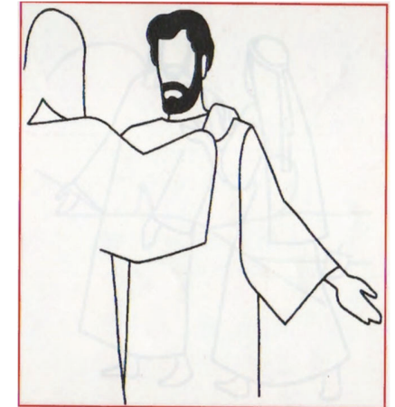
"HEUREUX ES-TU, SIMON FILS DE YONAS"

Incline vers moi ton oreille, Seigneur, exauce-moi. Sauve, ô mon Dieu, ton serviteur qui espère en toi. Prends pitié de moi, Seigneur, toi que j'appelle tout le jour. (cf. Ps 85, 1-3)