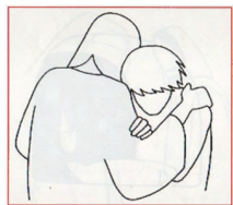
« VOTRE RÉCOMPENSE SERA GRANDE DANS LES CIEUX »

2 - Qui peut gravir la montagne du Seigneur et se tenir dans le lieu saint ? L'homme au cœur pur, aux mains innocentes, qui ne livre pas son âme aux idoles.